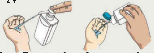
လကုခကြုထဲတပြုလကုဆေးကိုထည၍လကုတစုလုံးကိုသန့်၍ပေးပါ။