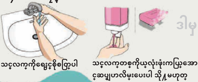
သင့်လကုကိုရေငှစိုစပြုပါ

အရကုပါဝင်သော လကုဆေးငှလကုကိုသန့်၍ပေးပါ (၂၀-၃၀စကုန)